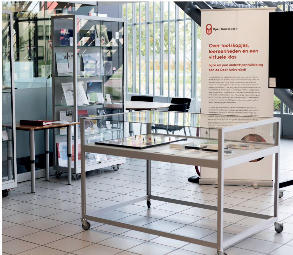
Wisselexpositie over 40 jaar onderwijsontwikkeling aan de Open Universiteit