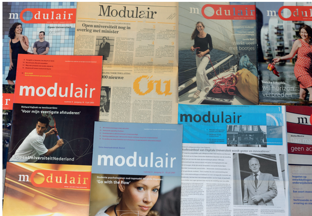
Een overzicht van Modulaïr door de jaren heen

Na het voltooien van het digitaliseren van alle papieren Modulaïr-edities (jaargangen van 1985 tot nu) heeft de commissie onderzocht hoe dit tot een toegankelijk en bruikbaar Modulaïr archief kan worden gemaakt. Er is in eerste instantie voor gekozen om het archief alleen intern openbaar te maken en op een later moment de mogelijkheden tot externe openbaarmaking verder te verkennen (dat wegens auteursrechten en de AVG iets ingewikkelder ligt). Met verschillende experts binnen de organisatie is overleg gepleegd om het Modulaïr-archief op MijnOU voor studenten en medewerkers te realiseren. Bij het verschijnen van dit jaarverslag is dit verwezenlijkt waarna er publiciteit aan is gegeven. Deze mogelijkheid terug te blikken sluit mooi aan bij het lustrumjaar. Niet alleen studenten en medewerkers kunnen nu 'terug naar toen', het archief kan ook dienst doen als bron van onderzoek. Modulaïr archief op MijnOU: https://mijn.ou.nl/group/mdw/-/modulaïr-archief (of via Thema's - Onderwijs – Modulaïr archief)