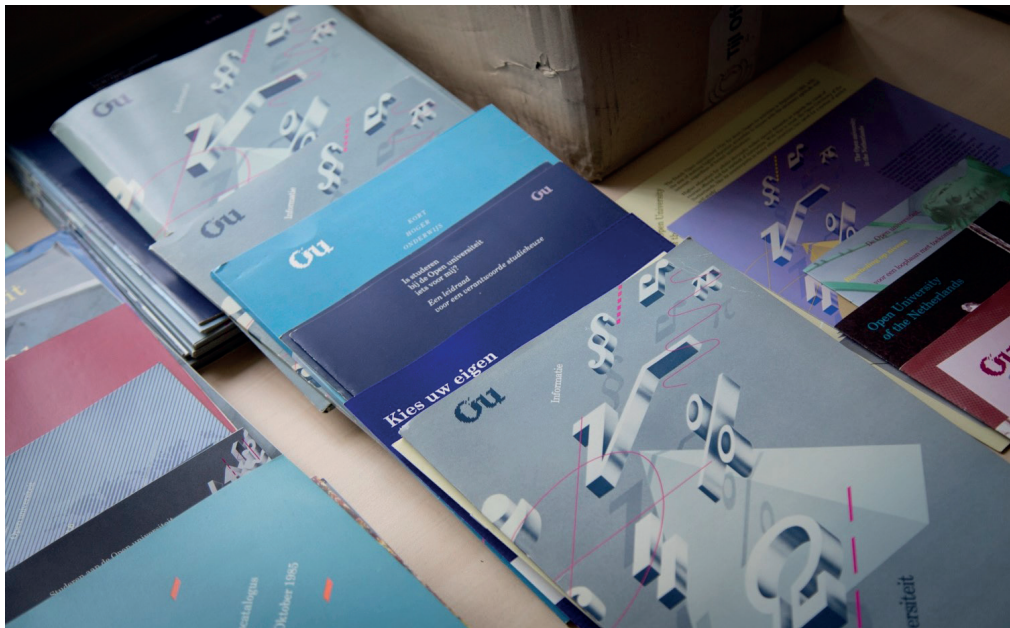
Een greep uit de collectie: studiegidsen

In een collectiebeleidsplan (gericht op de erfgoed- en kunstcollectie) waarmee de commissie al in 2022 een start maakte, is het de bedoeling een duidelijke lange-termijn visie te formuleren ten aanzien van het beheren en behouden van de collectie. Een specifiek onderdeel hiervan kreeg in 2023 prioriteit: concrete uitgangspunten en criteria voor het selecteren van stukken die al dan niet onder ‘erfgoed’ gerekend kunnen/moeten worden en bewaard dienen te worden. Ten eerste trad het belang van deze concrete richtlijnen voor de commissie zelf steeds meer op de voorgrond. Zo weten medewerkers van de OU de weg naar de commissie steeds beter te vinden, wat onder meer duidelijk wordt uit het grote aantal spullen dat aan de commissie wordt aangeboden. De noodzaak om hierin welbewust te selecteren (wat behoort wel, wat behoort niet tot ons erfgoed?) nam in 2023 toe.